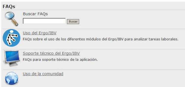
Figura 7. Contenido del apartado de FAQs de la Comunidad de Salud Laboral.

En el apartado FAQs encontrará las Preguntas Frecuentes realizadas por los usuarios de la aplicación organizadas por áreas temáticas (Figura 7):