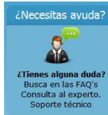
Figura 5. Bloque “¿Necesitas Ayuda?” de la aplicación Ergo/IBV.